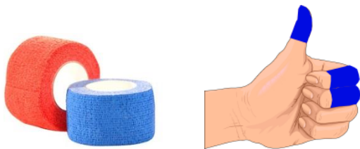
Plaster PLUS niebieski Szerokość rolki 3 cm Długość rolki 5,5 m

Certyfikaty producenta: ISO 14001-2004, producent produktów medycznych Klasy I ze znakiem CE, zarejestrowany w Niemczech, jako produkt medyczny po numerem: DE/CA66-BeSchuPla/001, kod producenta DE/116001945, zarejestrowany w Polsce jako wyrób medyczny klasy I.